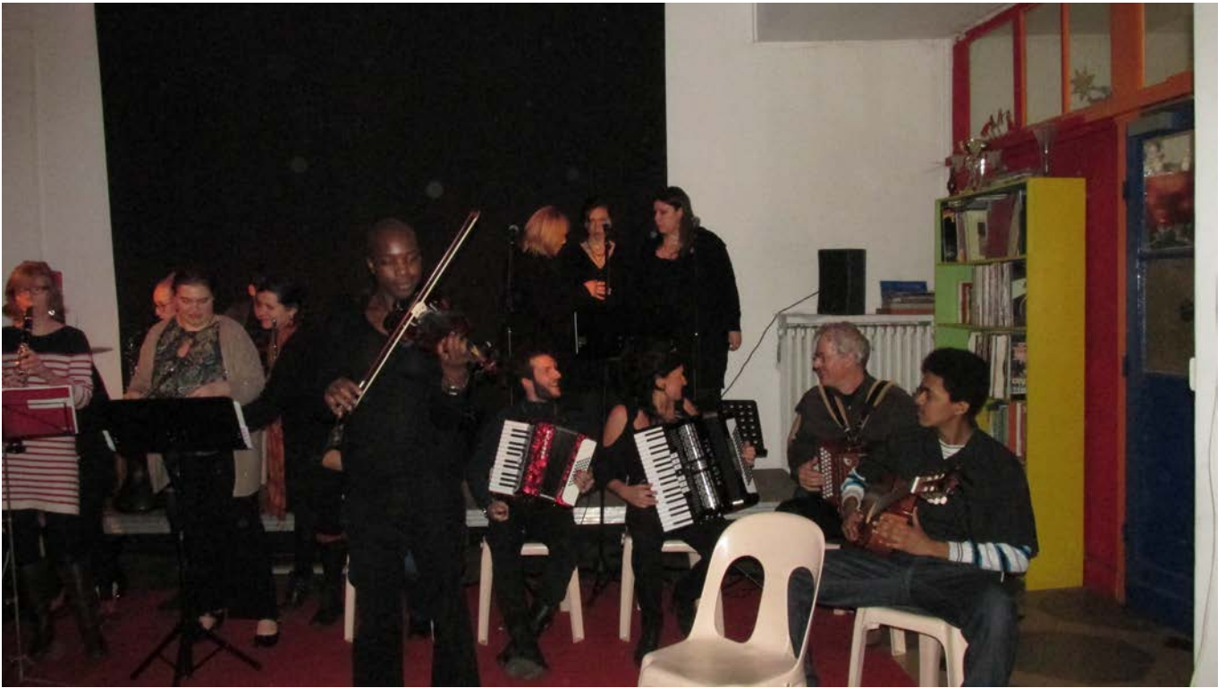
Tous au tire-laine du 11 décembre 2014