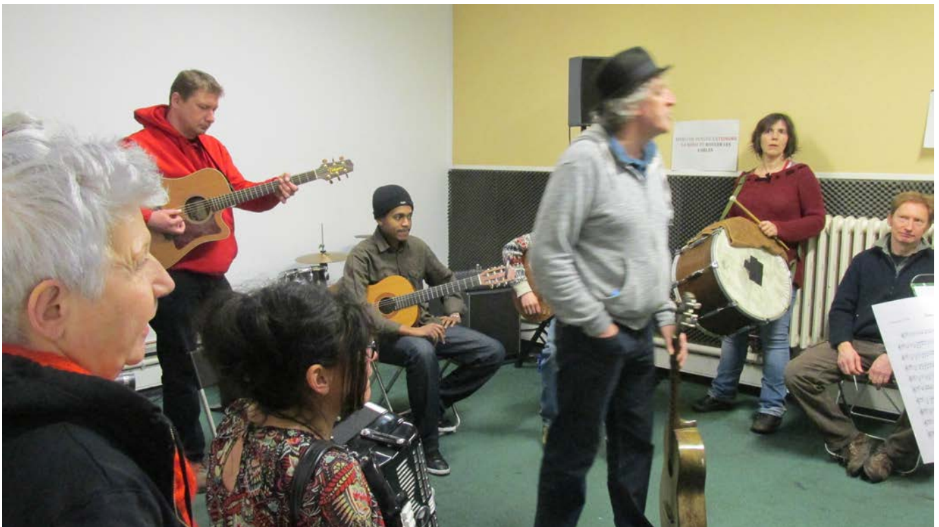
Travail en groupe

En 2014 : 93 personnes ont participé à au moins un atelier (pour découvrir ce qu'on y faisait) – 67 personnes se sont inscrites – 21 personnes ont arrêté en cours d'année ou à la rentrée suite à la réorientation du projet (mais les inscriptions ont été ré-ouvertes en janvier). Les ateliers ont mobilisé 11 musiciens et une administrative pour la coordination pour un total de 457 heures.